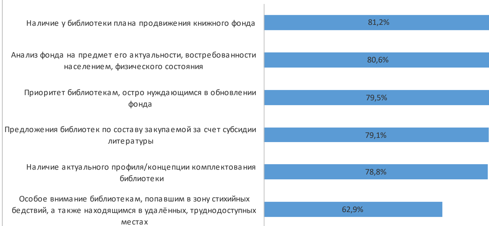
Рис. 6. Учёт установленных Минкультуры России критериев, на основании которых проводился конкурс