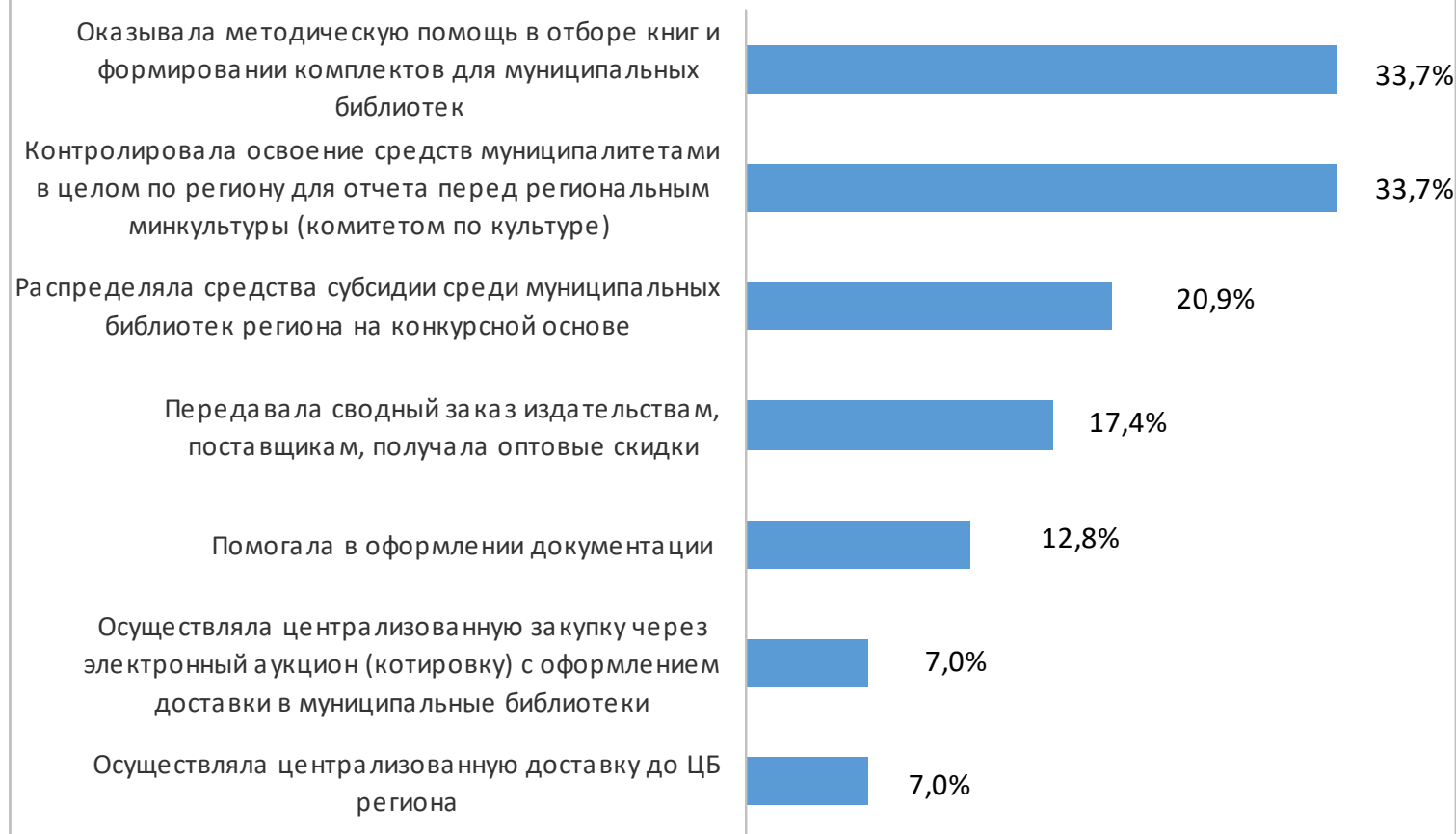
Рис. 4. Роль ЦБ региона в освоении субсидии муниципальными библиотеками