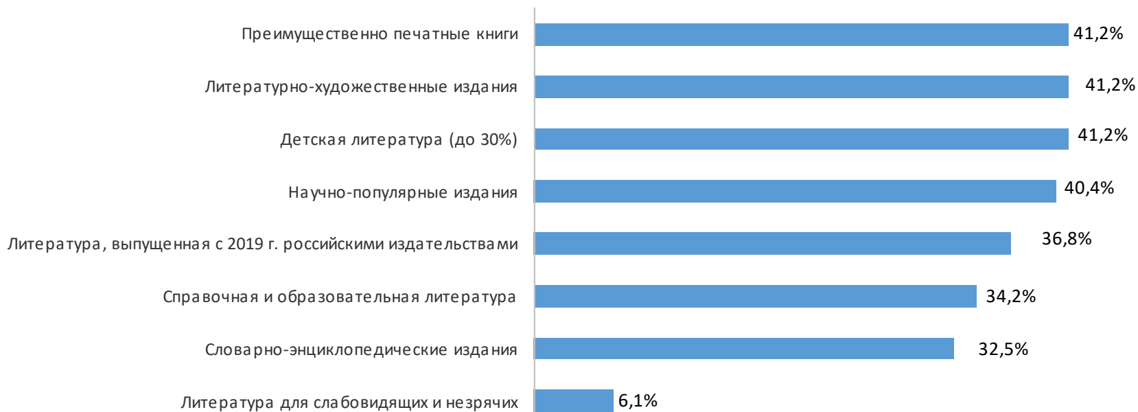
Рис. 7. Учёт рекомендаций Минкультуры России по видовому составу закупаемой литературы