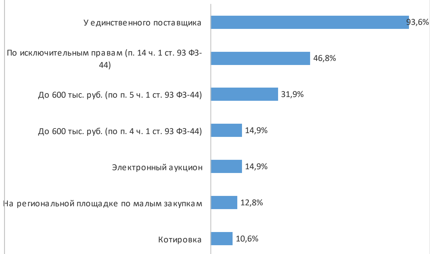
Рис. 1. Способ закупки по субсидии для ЦБ субъекта РФ