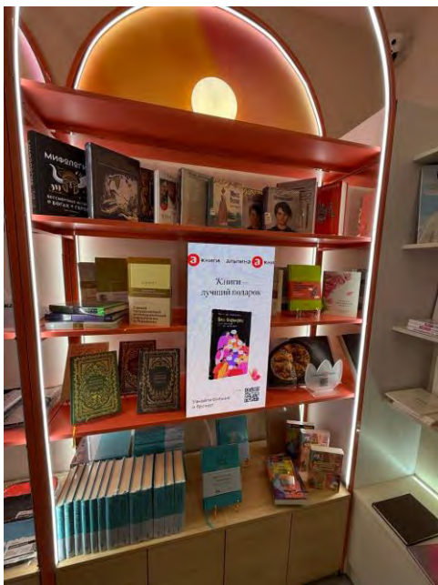
Корнер в магазине Флаувау