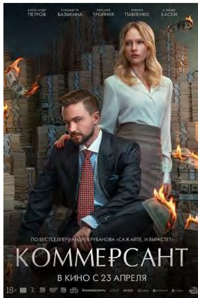
Фильм по мотивам «Сажайте и вырастет», А. Рубанов