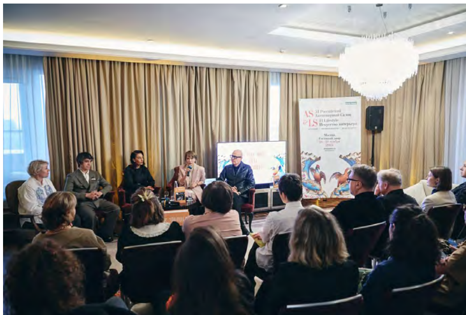
Арт-ланч в рамках открытия Антикварного салона