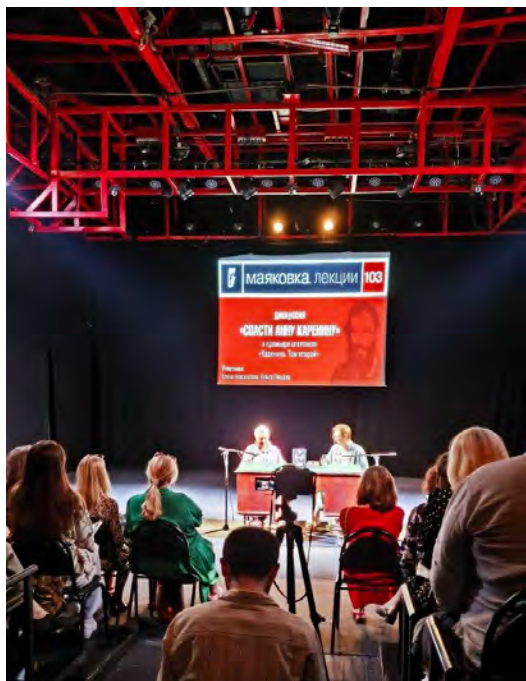
Театр Маяковского, «Спаси Анну Каренину»

Сотрудничество с культурными/креативными институтами