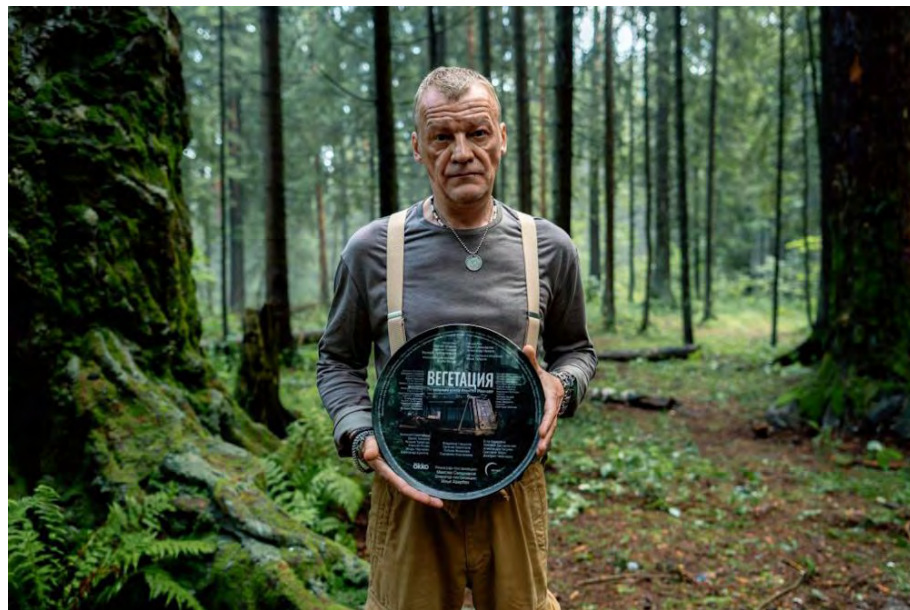
Сериял по мотивам книги Алексея Иванова «Вегетация»