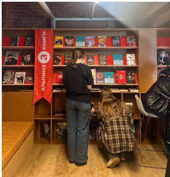
Библиотека «Альпины» в Чтиво Доме

Сотрудничество с культурными/креативными/спортивными институтами