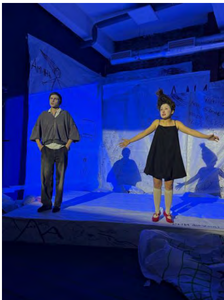
«Типа я», И. Ханипаев, спектакль «Студии десять»