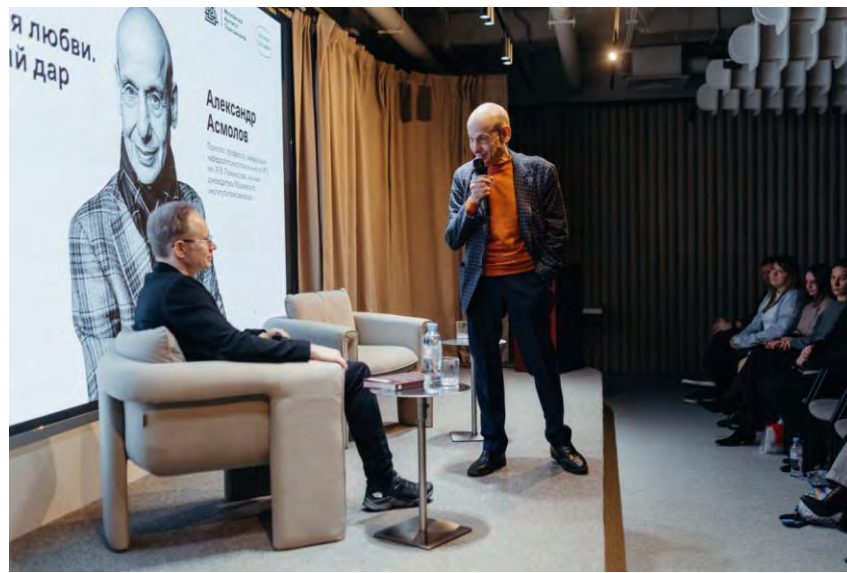
Закрытая презентация книги для читателей Reminder