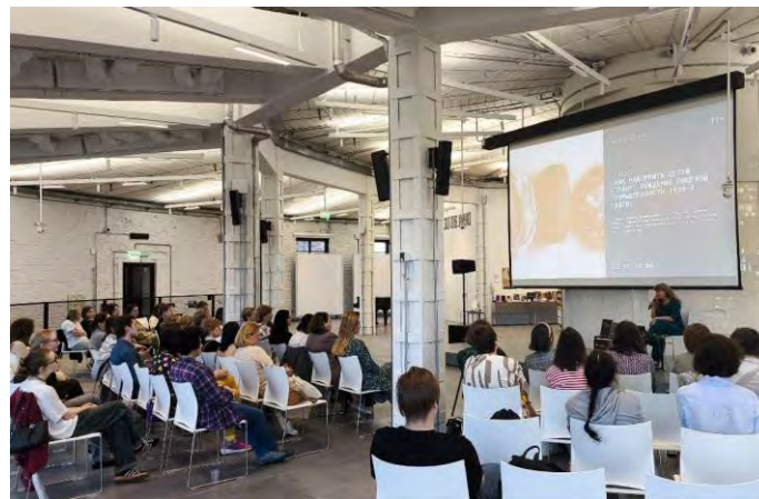
Лекция автора в Центре Зотов